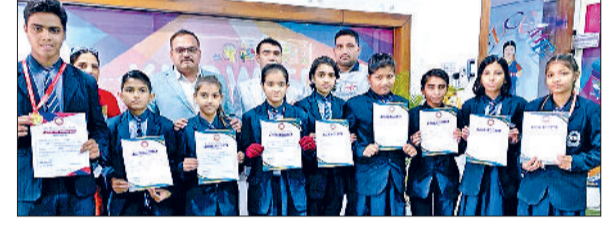
जीद। विजेता बच्चों को सम्मानित करते हुए।