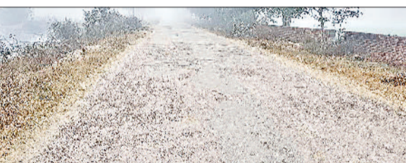
राजींद। सेरधा से कोटड़ा को जाने वाली सड़क पर बने गड्ढे।

■ सेरधा से कोटड़ा को जाने वाली सड़क के गड्ढे दे रहे हादसों को निमंत्रण