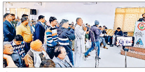
जींद। बैठक में शिकायत रखता शिकायतकर्ता।

परेशान, नप ईओ को दी चेतावनी। उन्होंने कहा कि पहले वह नप के एक ईओ को सस्पेंड कर चुके हैं। इस लिए सही तरीके से कार्य करें। शिकायतों में एक ऐसी भी शिकायत थी, जिसमें सास अपनी पुत्रवधु के गांव के आवारा युवकों के साथ अवैध संबंध होने तथा परेशान करने के बारे में बताया गया। जब परिजन विरोध करते हैं तो उन्हें बुरा अंजाम भुगतने की धमकी दी जाती है। जिस पर मंत्री ने एस्प्री से पूरी जानकारी लेकर उसकी वरिष्ठ अधिकारी से जांच करवाने के