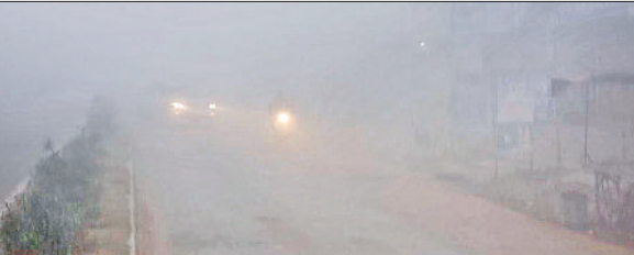
कोहरे के कारण लाइट जलाकर चलते वाहन चालक तथा ठंड से बचने के लिए अलाव का सहारा लेते ग्रामीण।

शीतलहर के चलते मौसम में ठंडक बढ़ने से जन जीवन पूरी तरह अस्त-व्यस्त होकर रह गया है। आलम यह है कि गुरुवार को दिनभर सूर्यदेव के दर्शन नहीं हुए। इससे पूरा दिन ठंड से जीवन अस्त-व्यस्त हो कर रहा गया। इस सर्द हवाओं में मौसम में ठंड के अहसास को एक बार फिर बढ़ा दिया है। ठंड का एहसास होने से दुकानदारों का धंधा भी गुरुवार को पूरी तरह चौपट होकर रह गया ठंड से बचने के लिए दुकानदार के