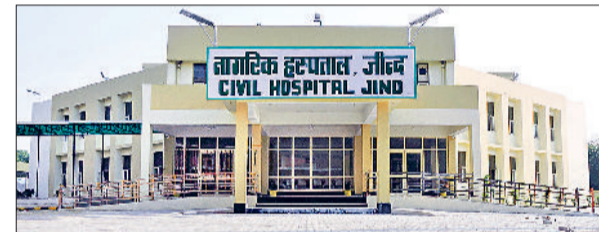
जींद। नागरिक अस्पताल जींद।

एक सप्ताह में दूसरी बार शुक्रवार को नागरिक अस्पतालों में चिकित्सक हड़ताल पर रहेंगे। इस बार इमरजेंसी व पोस्टमार्टम सेवाएं भी बंद रखे जाने की बात कही गई है। चिकित्सक केवल इस बात पर चर्चा कर रहे हैं कि कोई गंभीर मरीज हो और इलाज से उसकी जान बच जाए तो उसको उपचार दिया जाए। बुधवार को केवल ओपीडी को बंद रखा गया था। इसमें भी लोगों को काफी परेशानी हुई। अब इमरजेंसी व पोस्टमार्टम सेवाएं बंद होने से पूरी स्वास्थ्य सेवाएं चरमरा जाएंगी। ऐसे में लोगों को काफी सावधानी बरतने