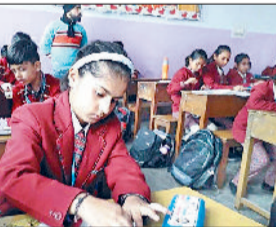
कैथल। डीएवी स्कूल के बच्चे प्रतियोगिता में भाग लेते हुए।