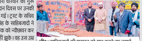
जीद। साहिबजादों की शहादत को याद करते हुए लगाई गई दूध की छव्बी।