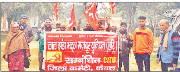
कैथल। मांगों को लेकर रोष जताते मजदूर।