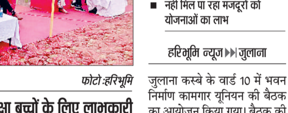
जीद। बैठक में भाग लेते भवन निर्माण कामगार यूनियन के सदस्य। फोटो: हरिभूमि

जीद। कार्यक्रम में भाग लेते छात्र। फोटो: हरिभूमि