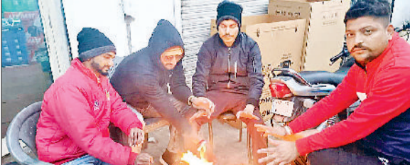
काफी अच्छी होने की संभावना है जितनी ज्यादा ठंड पड़ेगी उतना ही गेहूं को लाभ मिलेगा हालांकि सब्जी व अन्य फसलों के लिए यह ठंड

साथ साथ आमजन अलाव का साबित हो रही है किसानों को इसका असर बेजुबान पशु पक्षियों पर भी देखने को मिला। ठंड की अधिकता